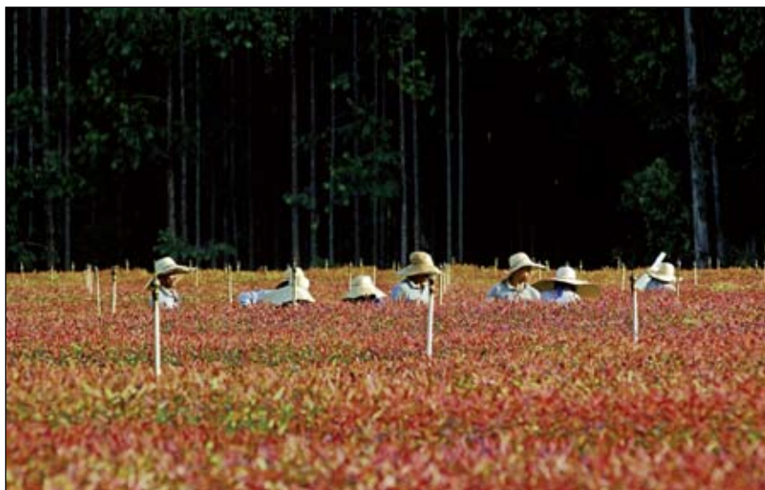
O programa Pousança Florestal, da VCP, incentiva pequenos produtores a plantarem eucaliptos e estimula a preservação da mata nativa

Cargnin também enxerga que não existe empresa sustentável, mas sim “empresa comprometida com sustentabilidade”. Ele comenta: “Existem indicadores em que você pode recuar e terá de trabalhar para corrigir. Por isso, ter um mapa de todas as ações é importante, para manter o foco do trabalho”.